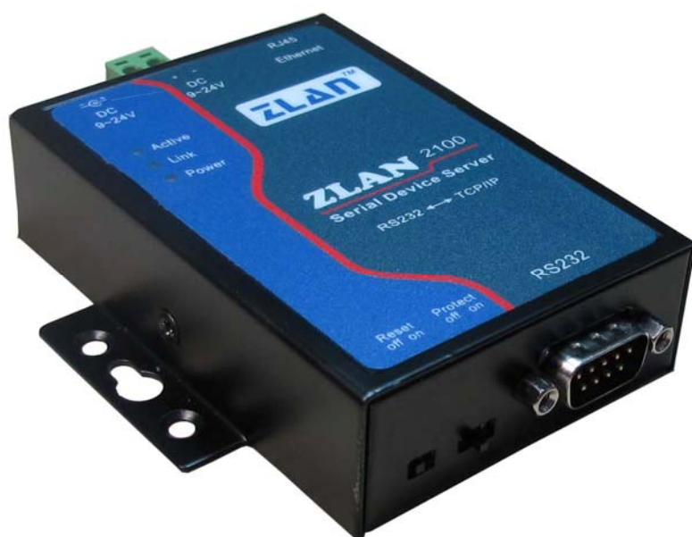
图 1 ZLAN2100 串口服务器

ZLAN2100 是一款高性价比的串口服务器，支持 DHCP、DNS，可轻松实现异地远程设备监控。支持虚拟串口，原有串口 PC 端软件无需修改。