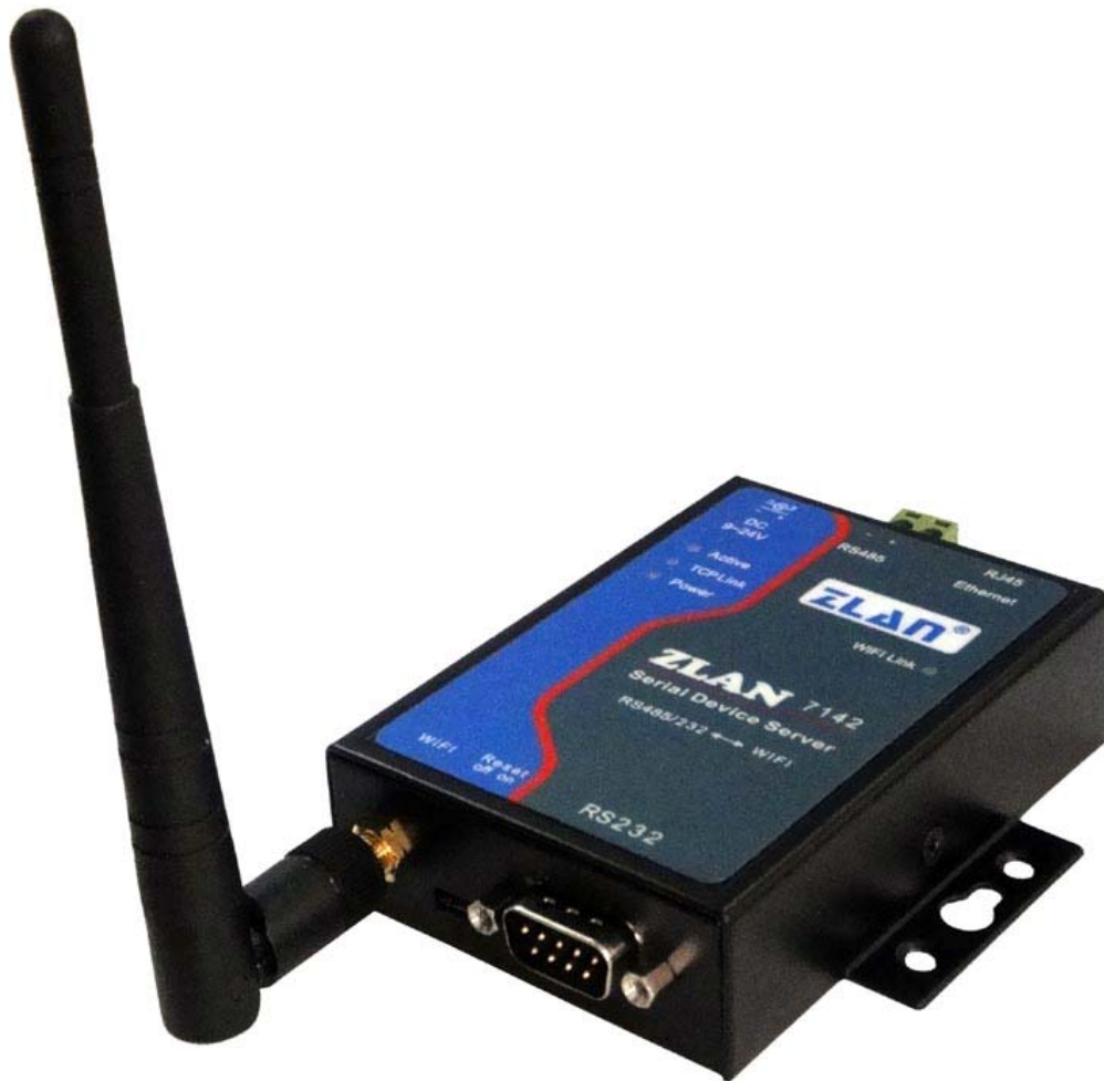
图 1 ZLAN7142 串口服务器