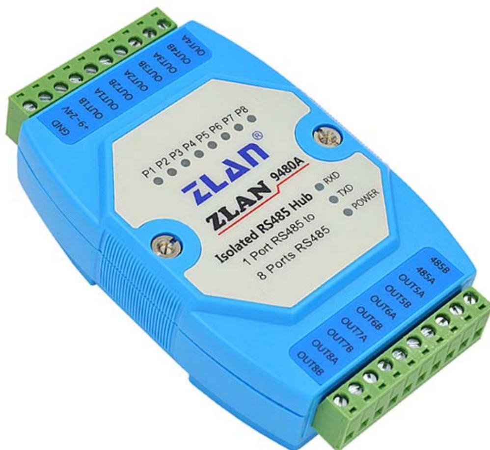
图 1 ZLAN9480A 外观

ZLAN9480A 是一款可通过一路 RS485 主口扩展出 8 路 RS485 从口的工业级隔离型 8 口 RS485 集线器。可以有效的实现 RS485 网络的中继、扩展与隔离。