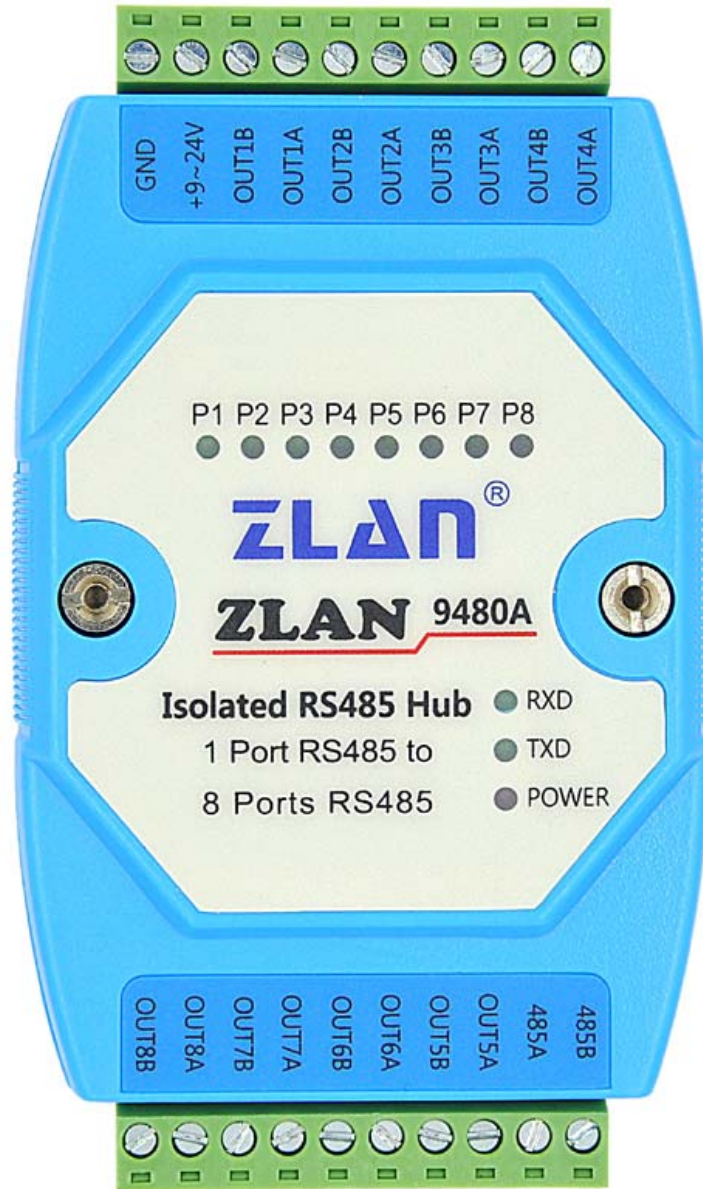
图 3 9480A 接口图