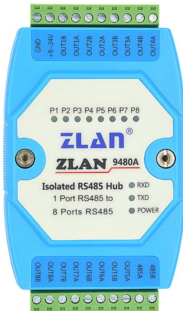
图 3 9480A 接口图